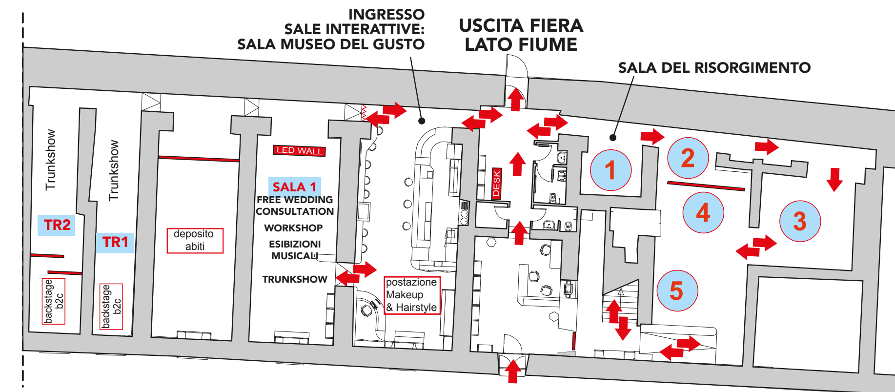
INGRESSO FIERA Via delle Caserme, 24